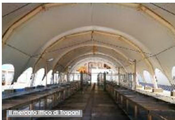
Il mercato ittico di Trapani

Lotta senza quartiere contro gli abusivi che tentano di operare nei pressi del mercato ittico. Le forze dell'ordine operano ormai con costanza i controlli per contrastare il fenomeno fino a qualche mese fa ampiamente diffuso della vendita abusiva di prodotti ittici privi di tracciabilità. La settimana appena trascorsa ha visto impegnata la Questura di Trapani nel coordinamento di servizi mirati a garantire la legalità nelle fasi della commercializzazione al dettaglio del pescato. L'obiettivo principale è quello di tutelare la salute dei consumatori; l'obiettivo secondario, ma non meno importante, è quello di salvaguardare i commercianti in regola con le autorizzazioni di legge e amministrative che già