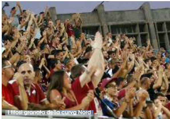
I tifosi granata della curva Nord