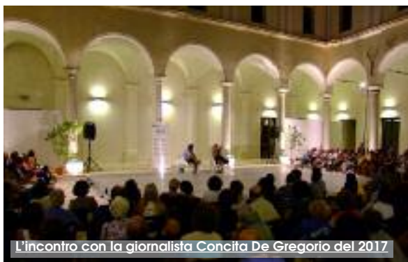
L'incontro con la giornalista Concita De Gregorio del 2017

Gli incontri si svolgono con inizio alle ore 19 presso il Chioostro del Complesso Monumentale di San Domenico, a Trapani. L'ingresso è libero. Grazie alla ras-