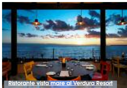
Ristorante vista mare al Verdura Resort

Quando si tratta di cucina siciliana chiunque riconosce la qualità, non c'è dubbio! Chissà cosa avranno esclamato attori e cantanti del calibro di Leonardo Di Caprio, Sting, Lady Gaga, davanti al fumante piatto di ravioli ripieni di pecorino, zucchini e menta, previsto nel menù del "Verdura Resort" offerto per la cena "blindata" del Google Camp. Il Locale News, ha pensato di farvi dare un'occhiata in esclusiva al Menù della serata affinché da siciliani doc possiate dire la vostra. Si comincia dagli antipasti: gamberetti, insalata di finocchio con mandorle caramellate, segue insalata di polpo e patate e pesto al grano saraceno con patate e fagiolini. Per quanto riguarda i primi, oltre ai già citati ravioli, sono state offerte orecchiette con pomodoro e ricotta, per la seconda portata, si è puntato al risotto con salsiccia di manzo, broccoli e cacio cavallo. Le seconde portate prevedevano: fettine di manzo marinate alla pizzaiola, filetto di