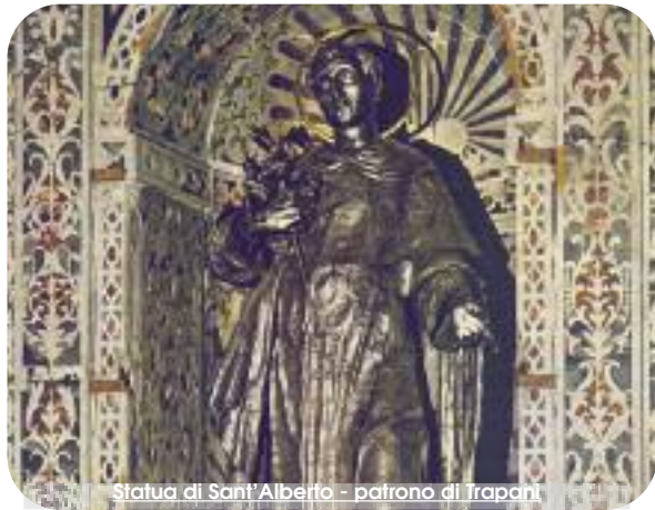
Statua di Sant'Alberto - patrono di Trapani

Con l'arrivo del mese di agosto, come da tradizione, i fedeli trapanesi vivono l'atmosfera magica di sentimento e trasporto per i solenni festeggiamenti patronali in onore della Madonna di Trapani, patrona della Diocesi e di S. Alberto degli Abbatì, carmelitano, patrono secondario della Diocesi e patrono della città di Trapani. Quest'anno per l'occasione sarà ospite della Diocesi e presiederà alla messa del 16 agosto, sua eminenza il cardinale Angelo Bagnasco, arcivescovo di Genova e presidente del Consiglio delle Conferenze Episcopali Europee. Durante la "Quindicina", iniziata da qualche giorno, al Santuario vengono accolti i pellegrini che provengono da ogni dove e nell'arco della giornata si alternano momenti di preghiera comune, al di fuori dei riti della Santa Messa. La predicazione della Quindicina è animata da Don Calogero Cerami e Don Giuseppe Licciardi, presbiteri della Diocesi di Cefalù. Dal 6 al 9 agosto si celebrerà la festa in onore di S. Alberto, patrono della città. Il primo giorno, al Santuario ci sarà il rito della benedizione dell'acqua e la distribuzione del cotone rimasto a contatto con la reliquia del cranio del Santo contenuta nell'argentea statua-reliquiario. In serata sarà trasportata la statua-reliquiario di S. Alberto dal Santuario alla Cattedrale per finire con la consegna delle chiavi della Città al Santo Patrono da parte del Sindaco Giacomo Tranchida.