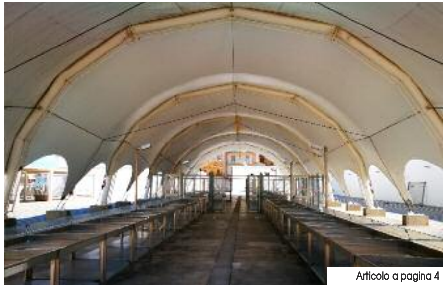
Articolo a pagina 4